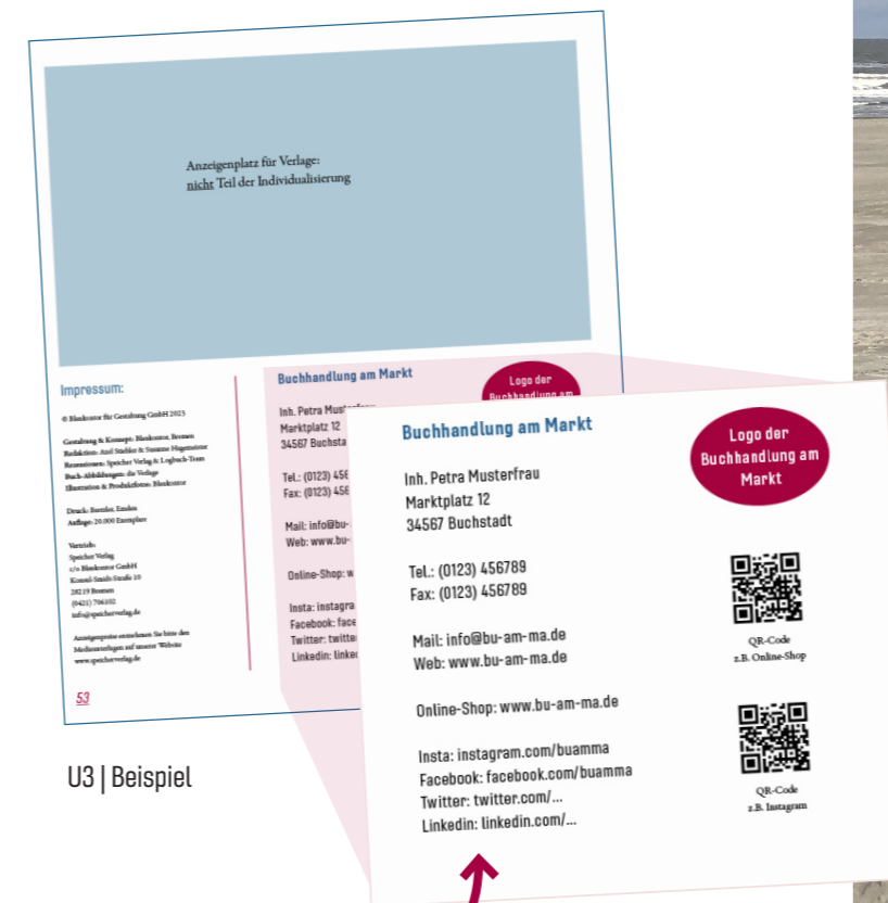
U3 | Beispiel

Alle Preise verstehen sich zzgl. MwSt. Versand- und Verpackungskosten.