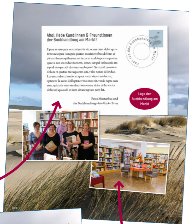
U2 | Individualisierung: Möglichkeit 1 / Postkarte