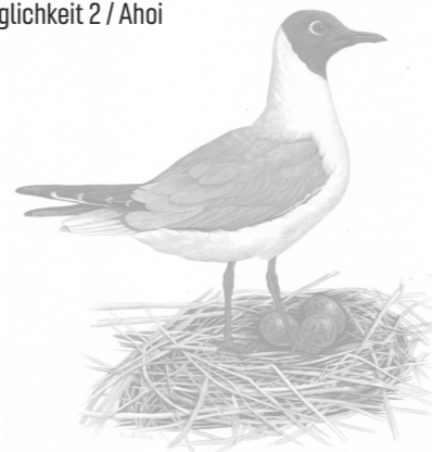
U2 | Individualisierung: Möglichkeit 2 / Ahoi